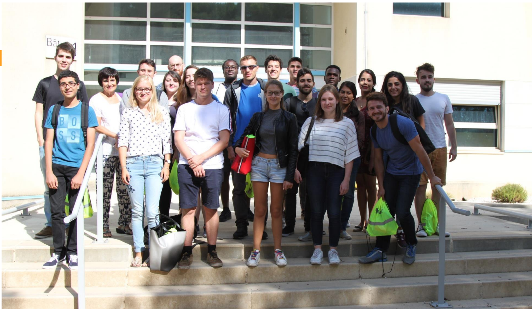
Accueil des étudiants étrangers.