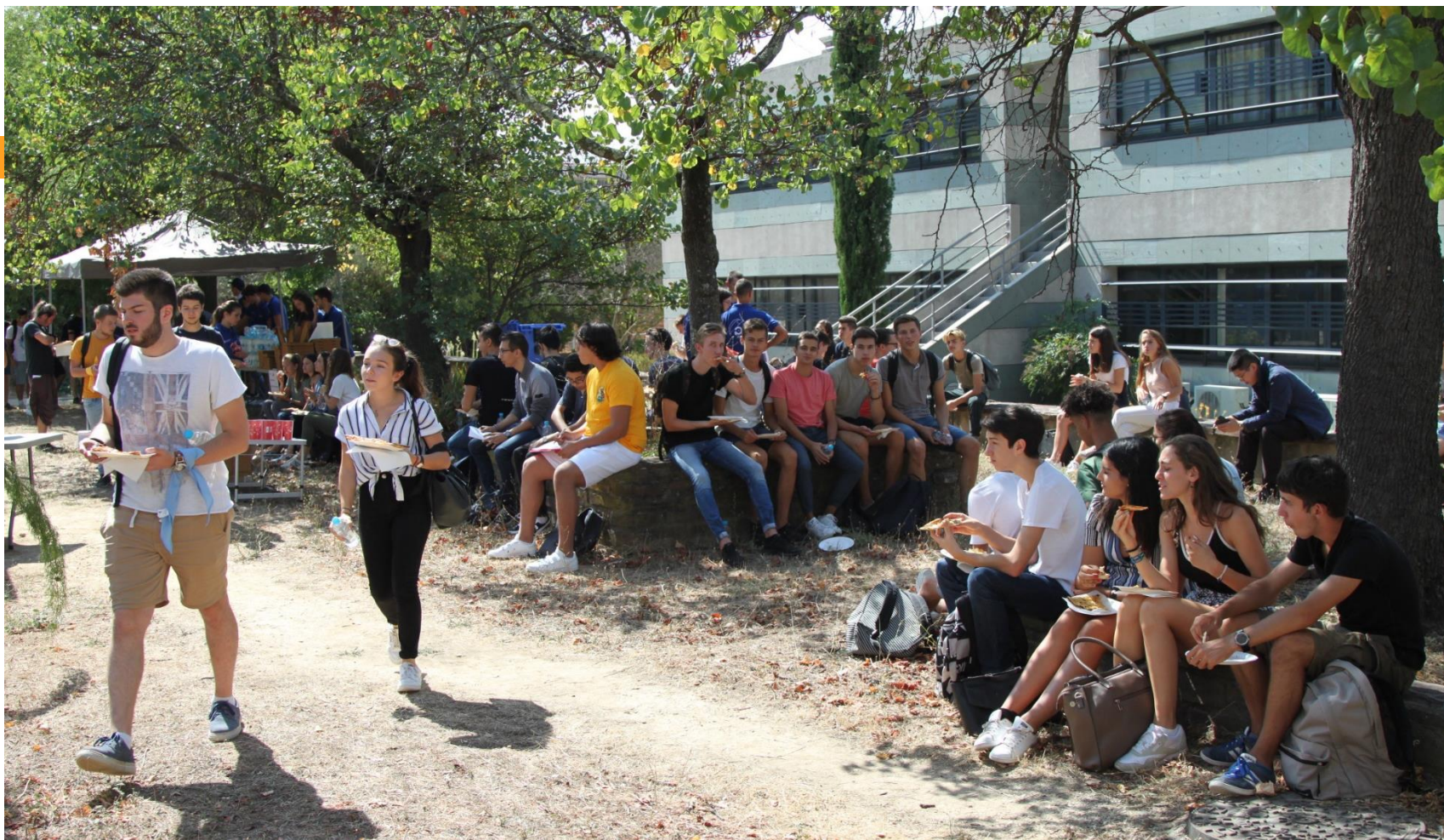
Repas de bienvenue, offert par l'école.