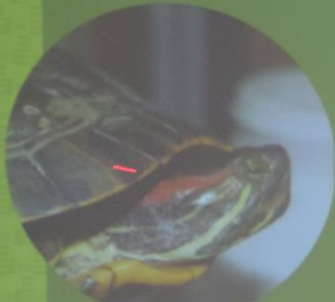
Trachemys scripta elegans