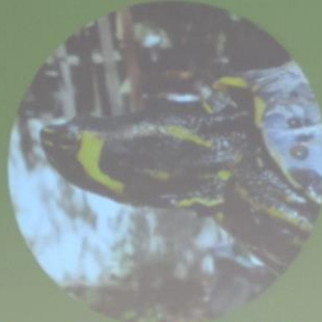
Hybride TSE / TSS