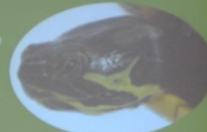
Trachemys scripta troostii