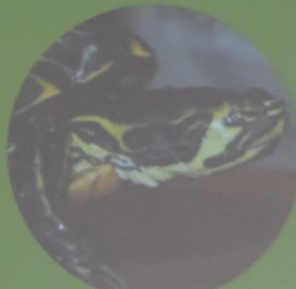
Trachemys scripta scripta