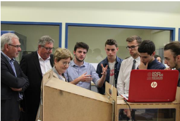
Lors des Olympiades 2018.

Judi 9 mai 2019, l'école d'ingénieurs Polytech Montpellier, en partenariat avec l'Académie de Montpellier, accueille pour la cinquième fois la finale académique des Olympiades de Sciences de l'Ingénieur (SI). Des lycéens viendront présenter leurs réalisations techniques et les meilleures innovations seront récompensées.