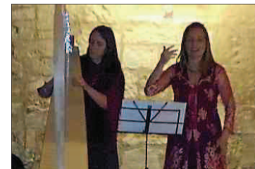
■ Le duo Awena.

du à l'invitation du foyer rural de la commune pour cette belle soirée qui s'est terminée par le verre de l'amitié autour d'une dégustation proposée par le vigneron Frédéric Jordy du domaine éponyme, dans la salle communale.