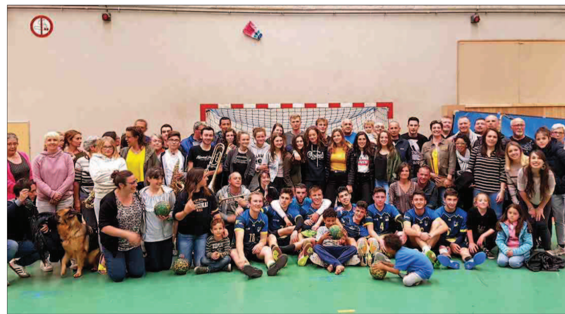
■ Joueurs, supporters et Réveil Lodévois ensemble à la fin du match des jeunes Lodévois.

Samedi 12 mai dernier, les moins de 18 ans de l' Athletic Club Handball ont dominé Béziers 36-31, se qualifiant ainsi pour les demi-finales de la Coupe de l'Hérault. Dans un match où le niveau était relevé de part et d'autre et dans une salle Ramadier surchauffée par les supporters et la fanfare du Réveil Lodévois, les locaux ont mené le match de bout en bout. Solides en défense et proposant un jeu collectif et dynamique en attaque, ils ont cependant dû faire face à une équipe de Béziers qui n'a pas baissé les bras et qui a toujours essayé de trouver la faille en attaque ou en défense recollant à chaque fois au score. C'est dans les dix dernières minutes que l'écart s'est réellement creusé. Tous les jeunes Lodévois ont répondu présent, par leur motivation et leur détermination à gagner ce match. Prochaine étape, le quart de finale du championnat Honneur-Ligue ce samedi 19 mai , à Narbonne au gymnase