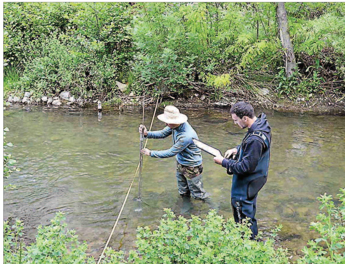
■ Faune, flore, qualité de l'eau, débit, géologie... Un diagnostic complet a été effectué.

Quatre sites sont donc ciblés : un premier en amont de Lodève sur la Lergue, un deuxième à la confluence de la Lergue et la Soulongre dans le cœur de ville, et les deux derniers en amont et en aval de la station