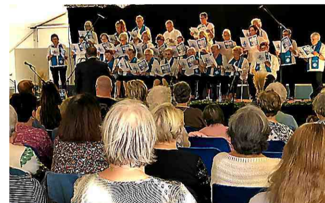
Concert de la chorale des seniors salle Brassens. CAMILLE LIEBEAUX

*Jeu sans obligation d'achat, organisé par votre quotidien. Tirage au sort en fin d'animation. Un seul gagnant par foyer.