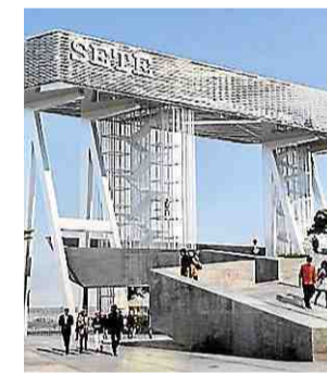
La gare maritime présentée à l'époque.

Cette semaine 120€ DE BONS D'ACHAT À GAGNER !